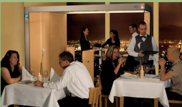
Raucherkabine in einem Gastraum